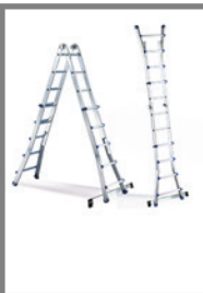
Se puede posicionar en tijera o en apoyo