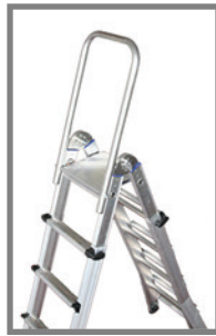
SICURKIT opcional que permite subir hasta el último peldaño