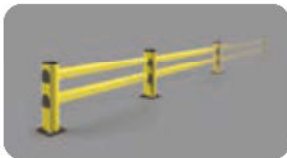
SM 1500x400 MODULAR