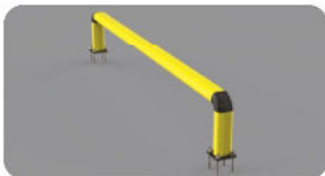
FE 150 2400x550

Length 2.400 mm Packing unpacked on pallet Colour B M