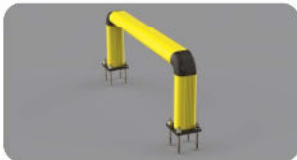
FE 150 1100x550

Length 1.100 mm Packing unpacked on pallet Colour B M