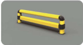
FE LINK 2400x550

Length 2.400 mm Packing unpacked on pallet Colour B M