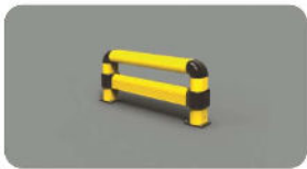
FE LINK 1100x550

Length 1.100 mm Packing unpacked on pallet Colour B M