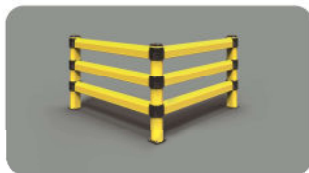
LINK 150/3 CORNER